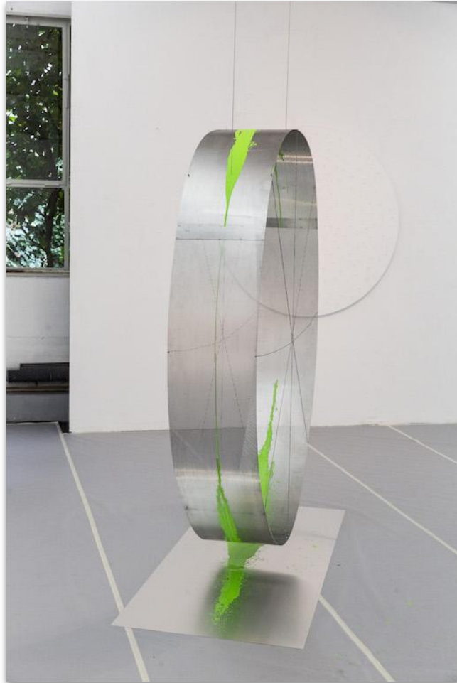
Oben: Transition 456h (Bild und Abbild), Farbe auf Aluminium, Ø 2m, Ausstellungshalle 1A, Frankfurt a. M., 2018 Rechts: Burst (6336 Seconds), 6336 Maischips auf Nylonfaden, Ausstellungsansicht Kunstraum Ka:Ost, Frankfurt a. M., 2019