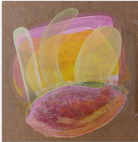
Vivienne, Acryl auf MDF, 30x30 cm, 2023