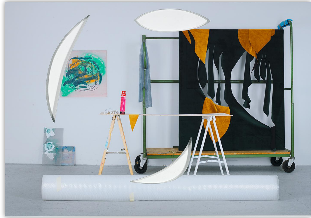
#Das Atelier (Mariendistel), Fine Art Druck auf Aludibond, gefräst, 135x90 cm, 2022