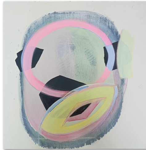
Sebastien, Acryl auf Leinwand, 50x50 cm, 2023