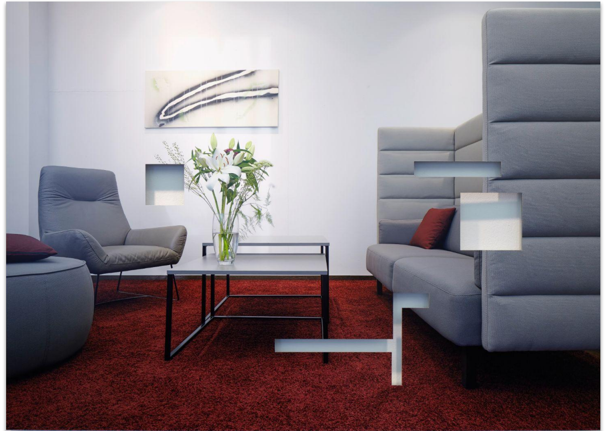
#OFD (1) 22.08.2022, Fine Art Druck auf Aludibond, gefräst, 100x135 cm, 2022