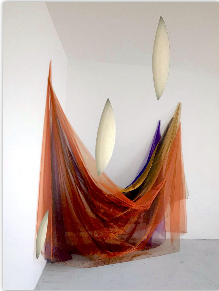
#Emilia, Fine Art Druck auf Aludibond, gefräst, 60x80cm, 2022