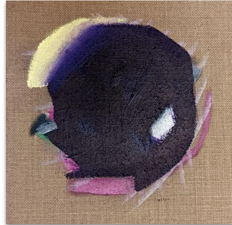
Donald, Öl auf Leinen, 30x30 cm, 2023