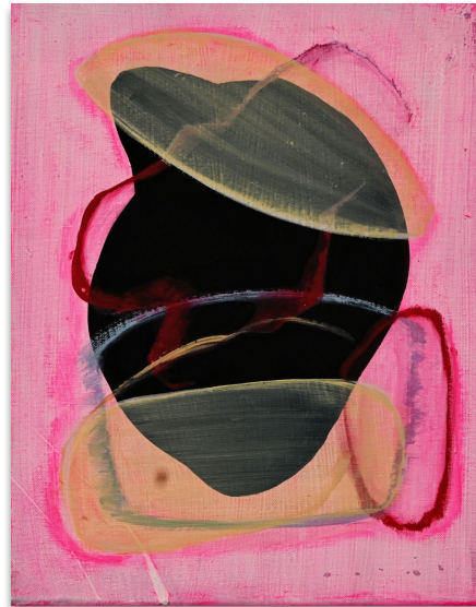
Helen, Acryl auf Leinwand, 30x40 cm, 2023