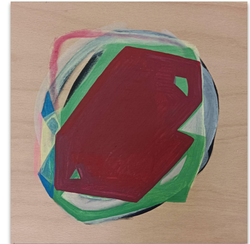
Vincent, Acryl auf Holz, 25x25 cm, 2023