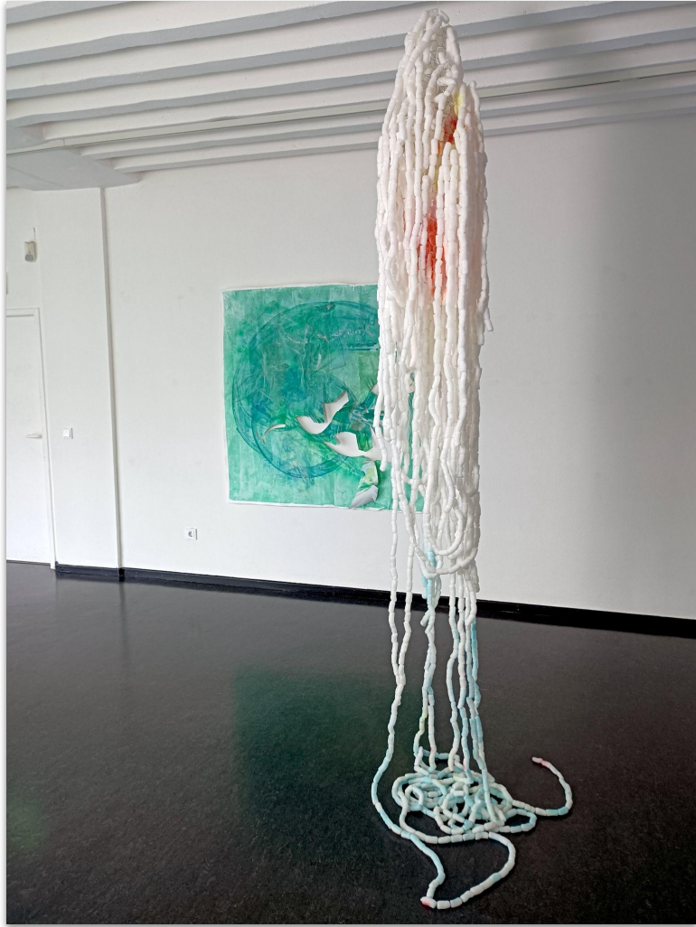
Ein Hauch Leben (3000 sec), 2021, 3000 Maischips auf Nylonfaden, Draht (Ausstellungsansicht, Kunsthalle Darmstadt)