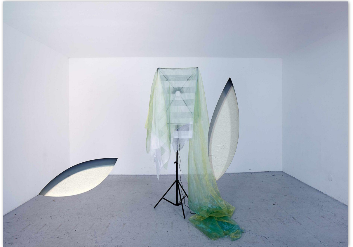
#Anna-Lena, Fine Art Druck auf Aludibond, gefräst, 135x90 cm, 2022