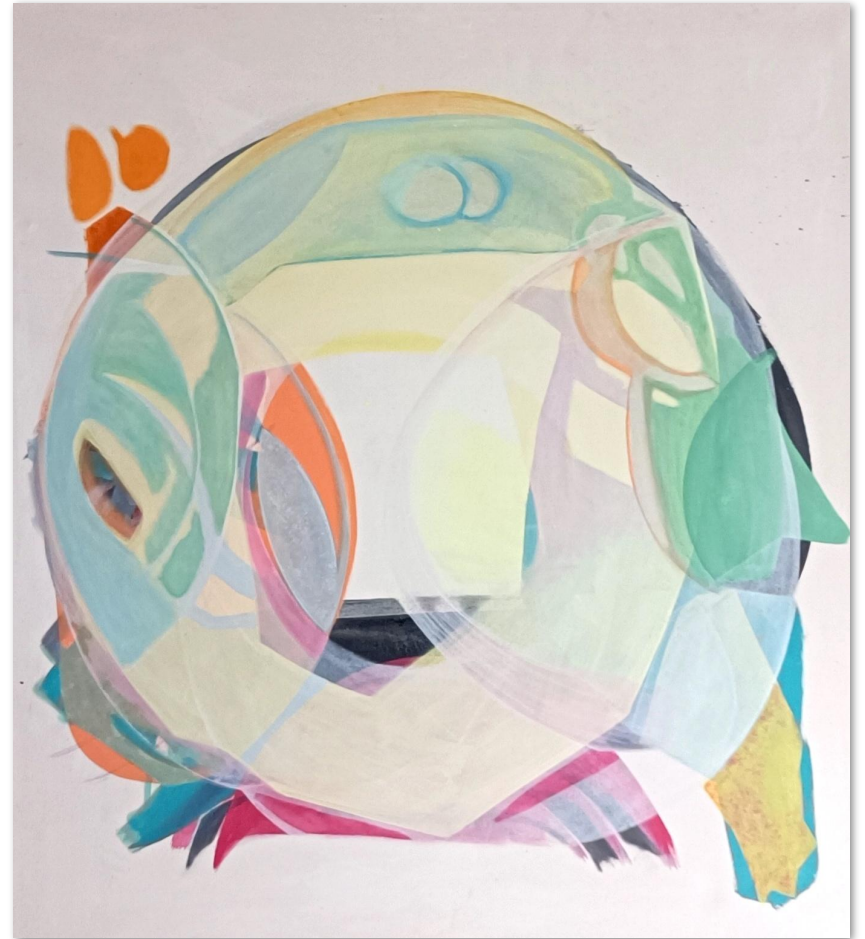
Lacy, Acryl auf Leinwand, 180 x 160 cm, 2023