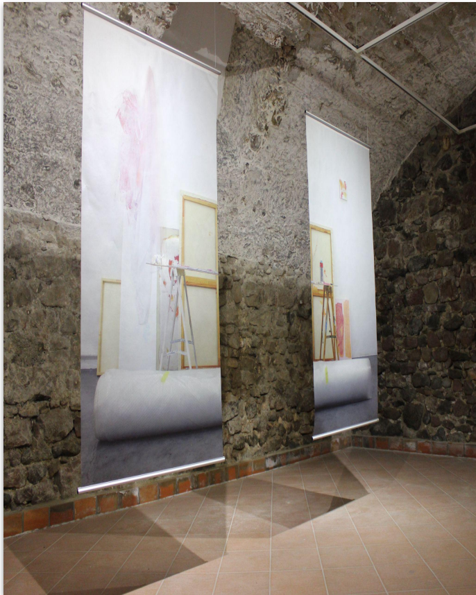
#Das Atelier, UV-Druck auf Transparentpapier, 90x180 cm (2) 2022, Ausstellungsansicht Kunstforum Seligenstadt