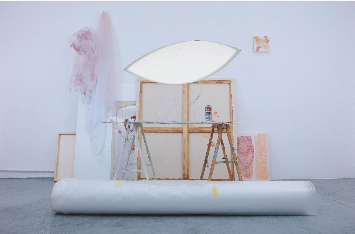
#Das Atelier, Fine Art Druck auf Aludibond, gefräst, 135x90 cm, 2022