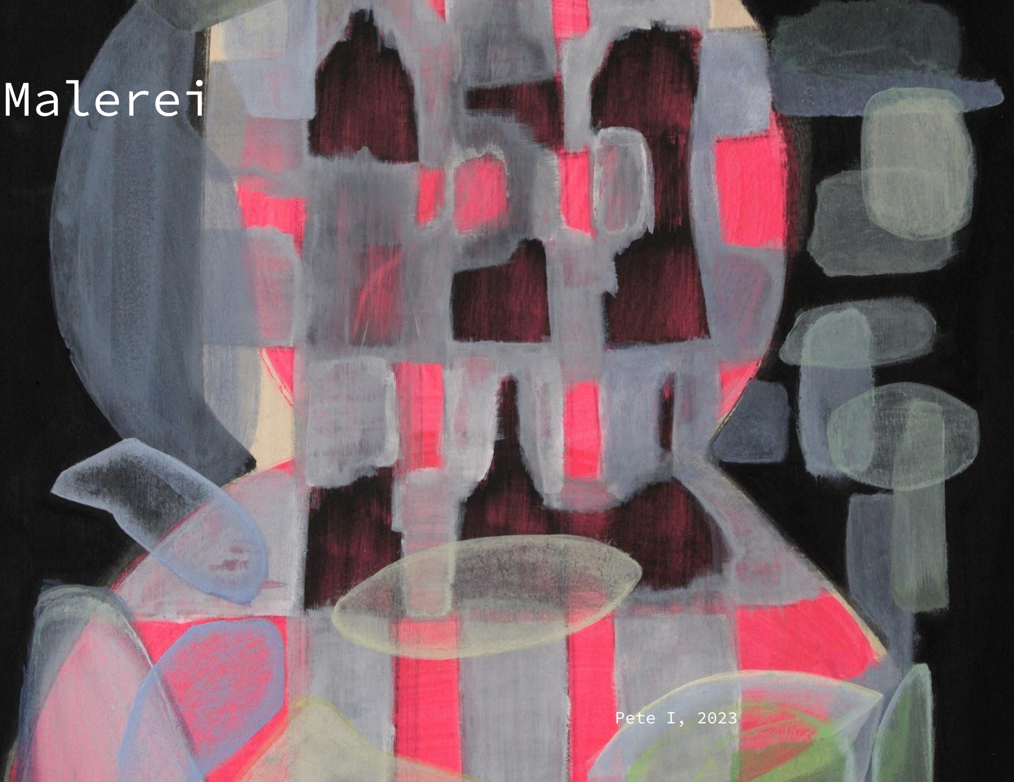
Pete I, 2023