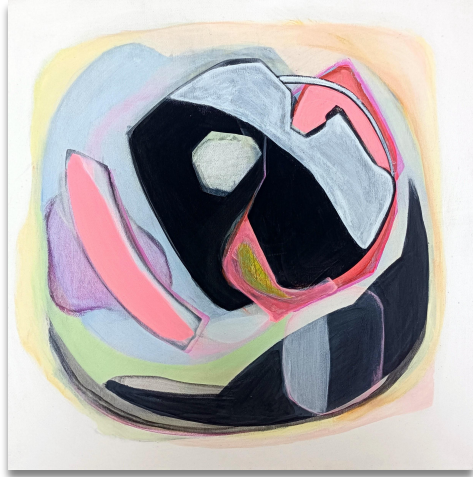
Michelle, Acryl auf Leinwand, 50x50 cm, 2023