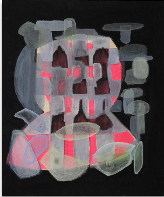
Pete I, Acryl auf Holz, 50x70 cm, 2023