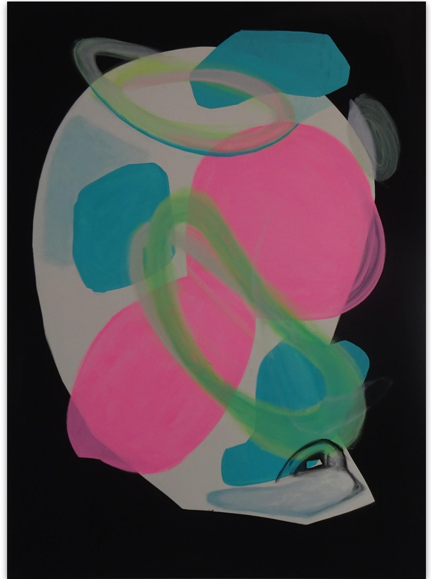
Pete II, Acryl auf Leinwand, 110x150 cm, 2023