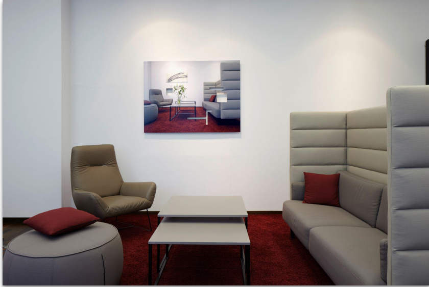
#OFD (1) - Ausstellungsansicht Kreativraum Oberfinanzdirektion Frankfurt am Main, 2022