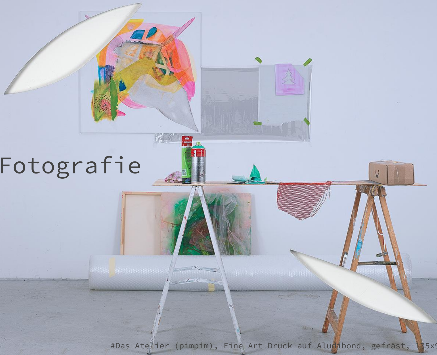
#Das Atelier (pimpim), Fine Art Druck auf Aludibond, gefräst, 135x90 cm, 2022