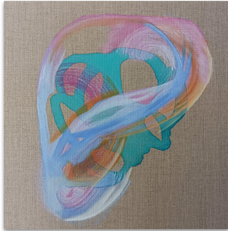
Elio, Acryl auf Leinen auf Karton, 30x30 cm, 2023